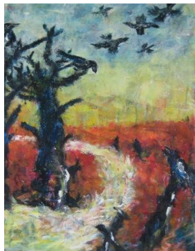
Hvor kragerne vender. ...