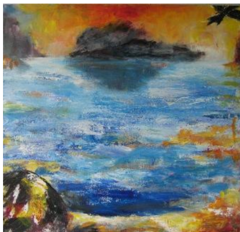
Fuglen er fløjet

Der er flere "talemåder" på mit værksted.