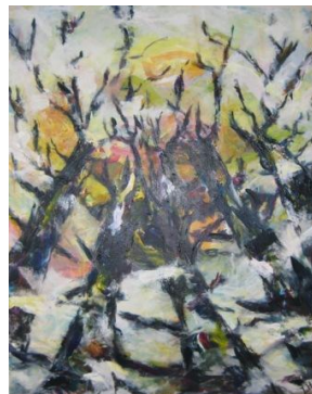
Ingen træer vokser ind i...