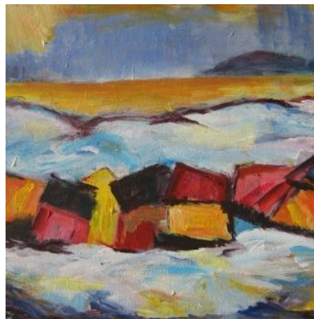
En by i Rusland